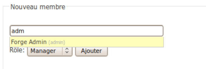
Illustration 2: Ajout d'un nouveau membre

Pour ajouter un membre à un projet, il faut que l'utilisateur soit connu de la forge, c'est-à-dire qu'il se soit connecté au moins une fois. Ensuite, le manager doit aller sur la page 'Configuration > Membres' de son projet. Dans le champ texte, il faut saisir les premières lettres du prénom, du nom ou de l'identifiant de l'utilisateur et sélectionner l'utilisateur dans la liste proposée.